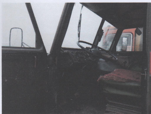
Zdj. 9. Widok ogólny