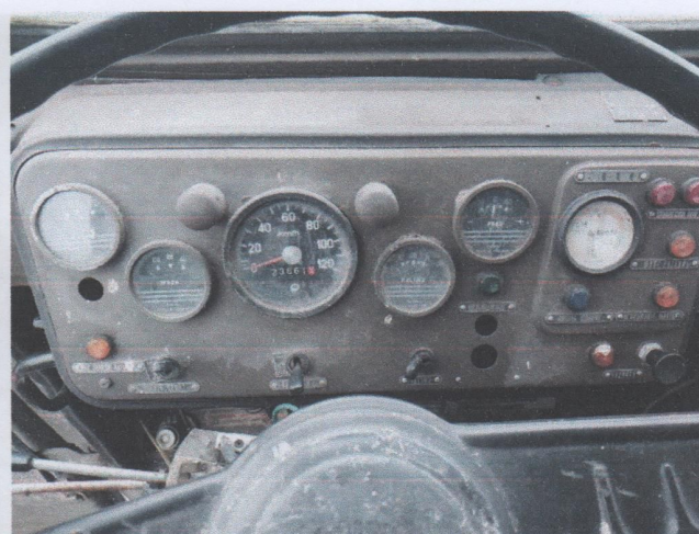
Zdj. 10. Widok ogólny