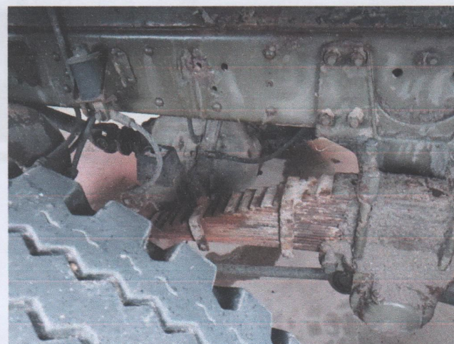
Zdj. 12. Widok ogólny