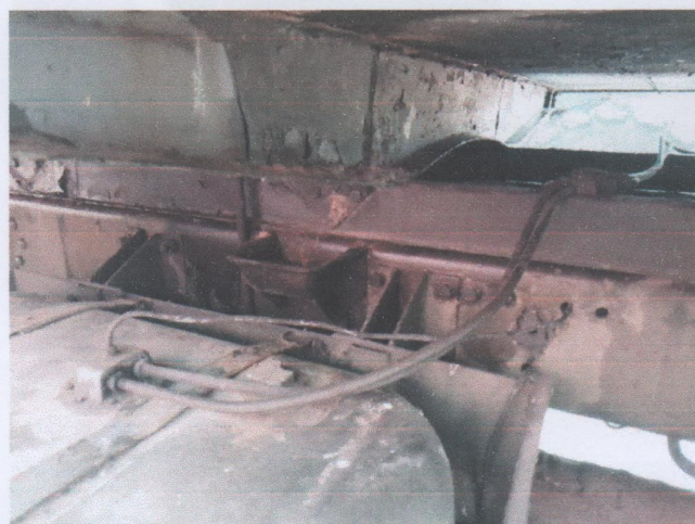
Zdj. 11. Widok ogólny