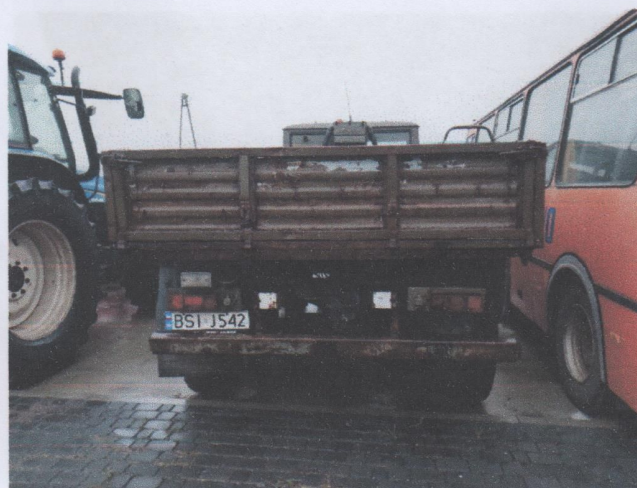
Zdj. 8. Widok ogólny