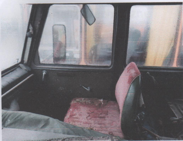
Zdj. 13. Widok ogólny