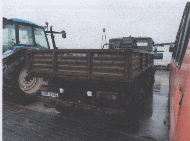
Zdj. 4. Widok ogólny