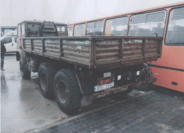
Zdj. 3. Widok ogólny