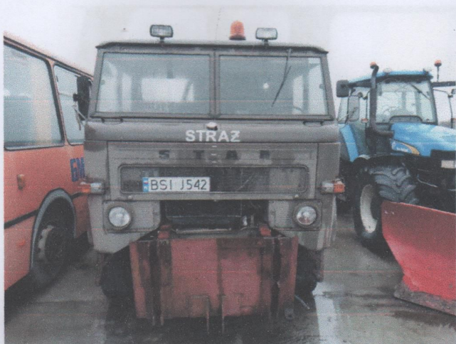
Zdj. 7. Widok ogólny