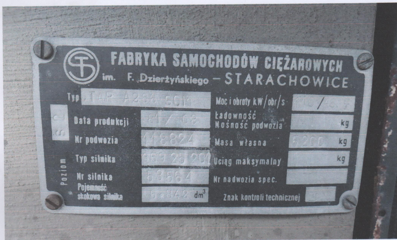
Zdj. 15. Widok tabliczki znamionowej pojazdu.

Zakres oceny: Określenie stanu pojazdu oraz oszacowanie jego wartości rynkowej