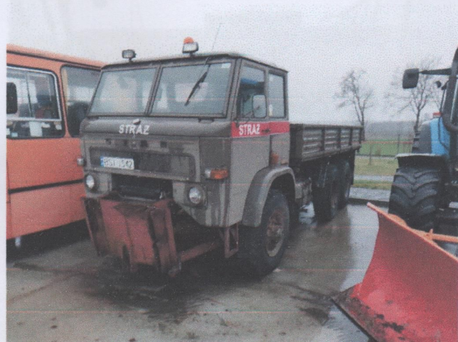
Zdj. 1. Widok ogólny