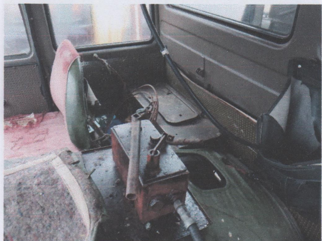
Zdj. 6. Widok ogólny