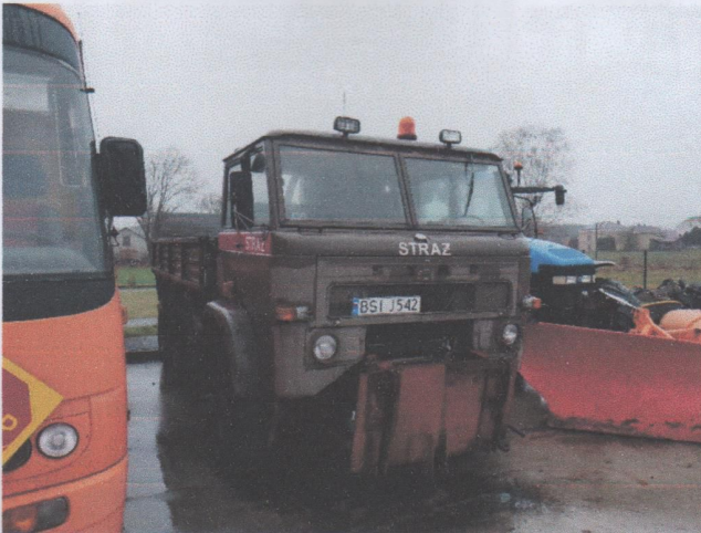
Zdj. 1. Widok ogólny