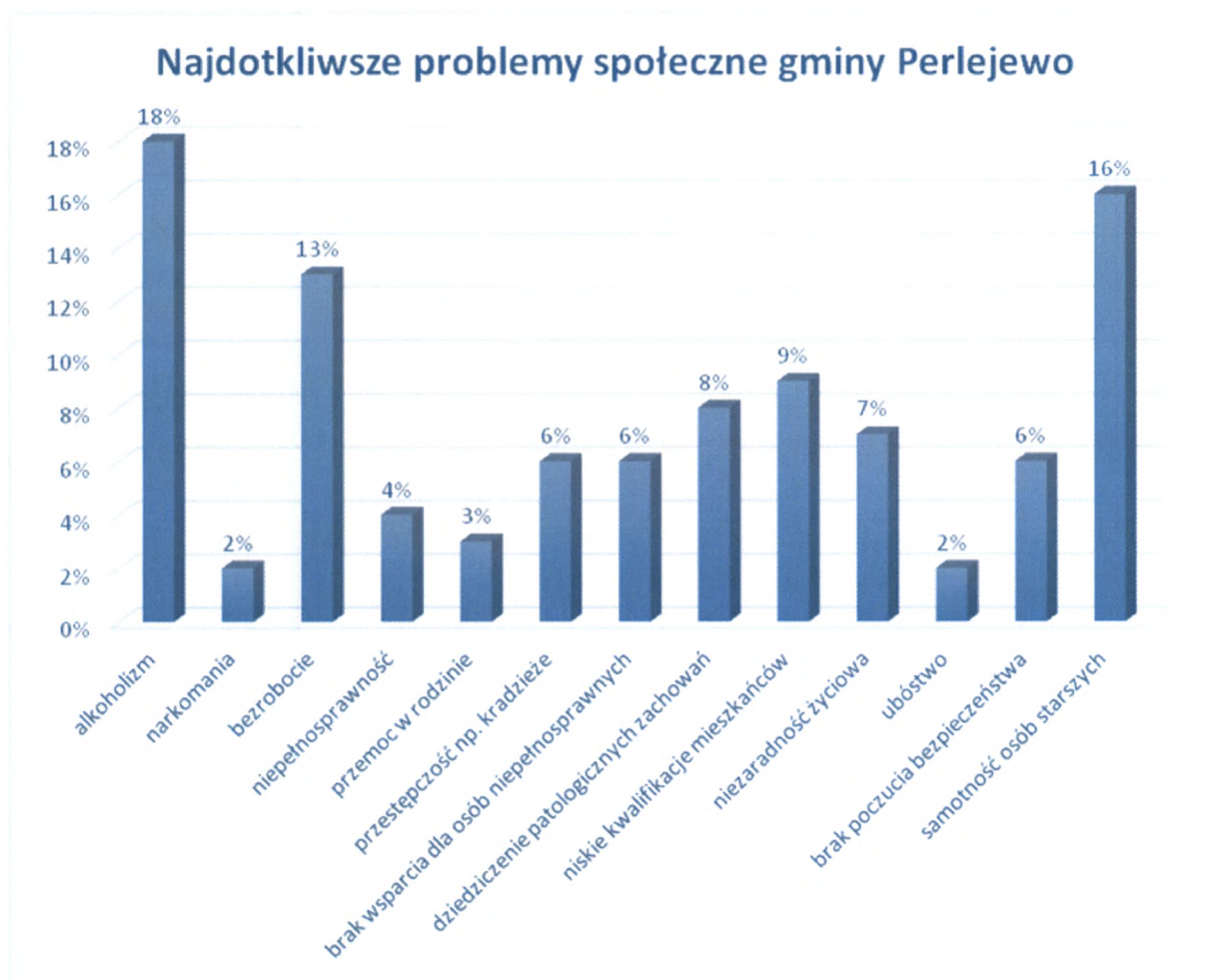
Wykres 2. Najdotkliwsze problemy społeczne gminy Perlejewo wg ankietowanych.